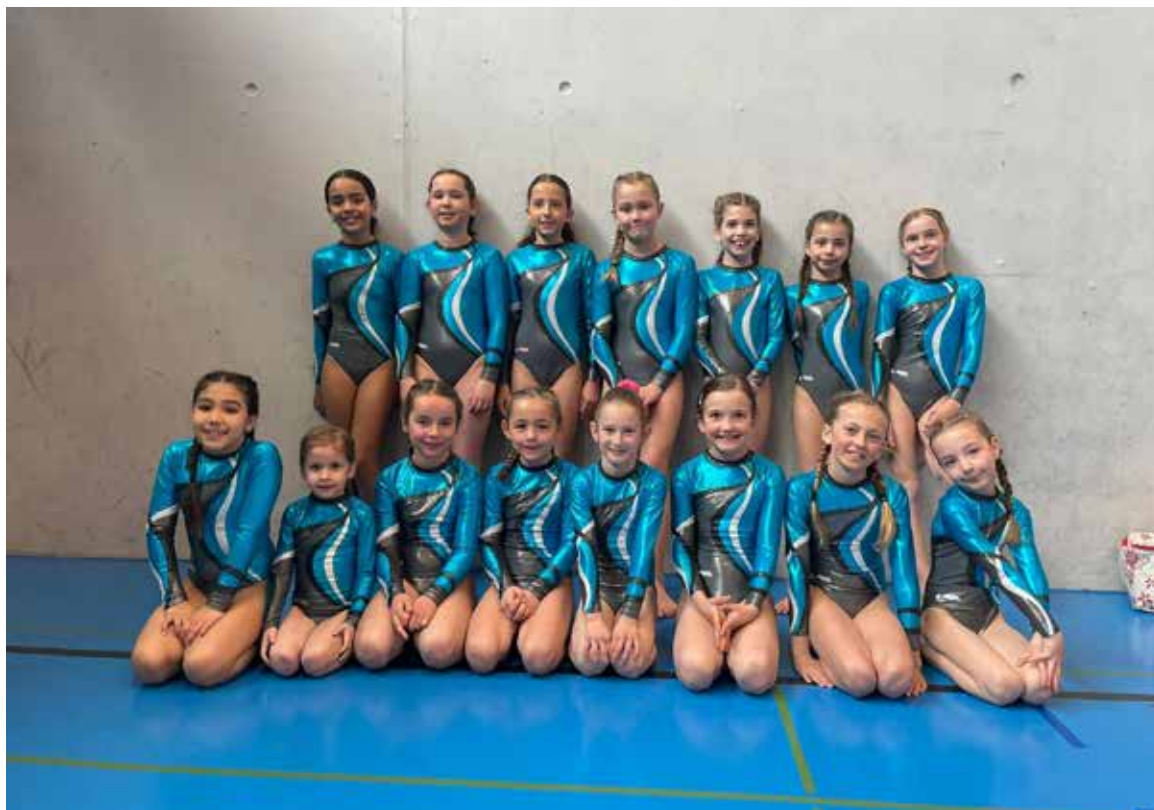
Les Agrès lors de la Team-Cup