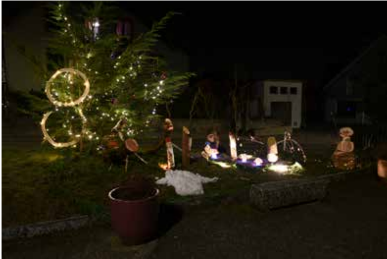
Acer Jardin & StefaCo Rte de la Croix 48 / 8 décembre