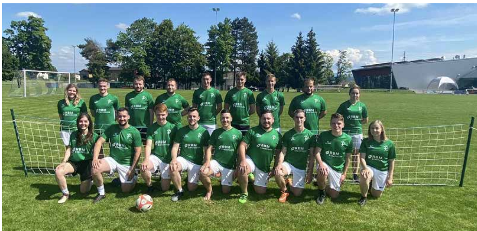
Photo du club avec nos nouveaux maillots