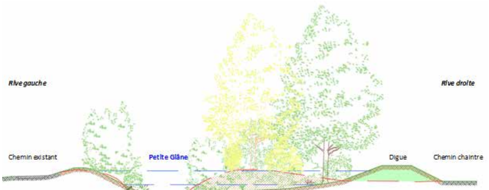
Profil en travers type de l'élargissement du cours d'eau en rive droite, avec défrichage, recul de la digue et plantation (CSD)

grande taille qui investiront aussitôt l'espace et profiteront au paysage riverain de la Petite Glâne. A terme, la surface boisée sera environ deux fois plus importante qu'avant les travaux de végétalisation.