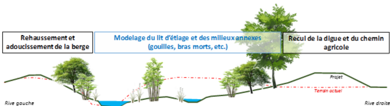
Schéma du principe de revitalisation

A l'état actuel, la Petite Glâne présente une végétation riveraine relativement banale et très éparse selon les endroits. Bien que certaines formations arbustives actuelles revêtissent un certain intérêt (haies et bosquets), le bilan du projet de revitalisation sera largement positif concernant la biodiversité et le paysage notamment. En effet, les importantes plantations prévues et les autres aménagements permettront à la Petite Glâne de retrouver une végétation arborescente et arbustive dense et variée. Au total, près de 20'000 arbres et arbustes seront plantés, parmi lesquels plusieurs dizaines d'arbres tige de