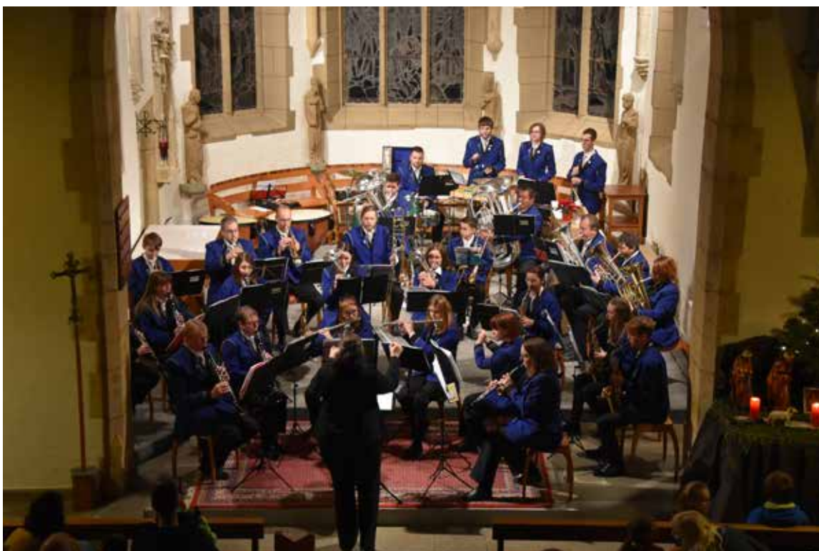
La Caecilia lors du concert de l'Avent 2021

Cependant, il n'y a pas que les plus anciens qui font vivre notre société, la Caecilia a la chance de compter sur une école de musique forte et qui regorge de petits talents.