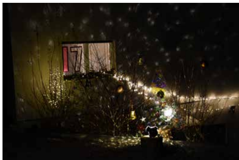
VitreRime, Fam. Maude & Raphaël Rime Rte de Sous-Pendu 7 / 17 décembre