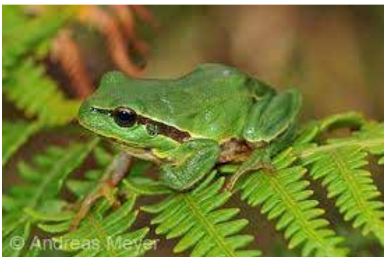
La Rainette verte, une espèce-cible du projet (karch.ch)