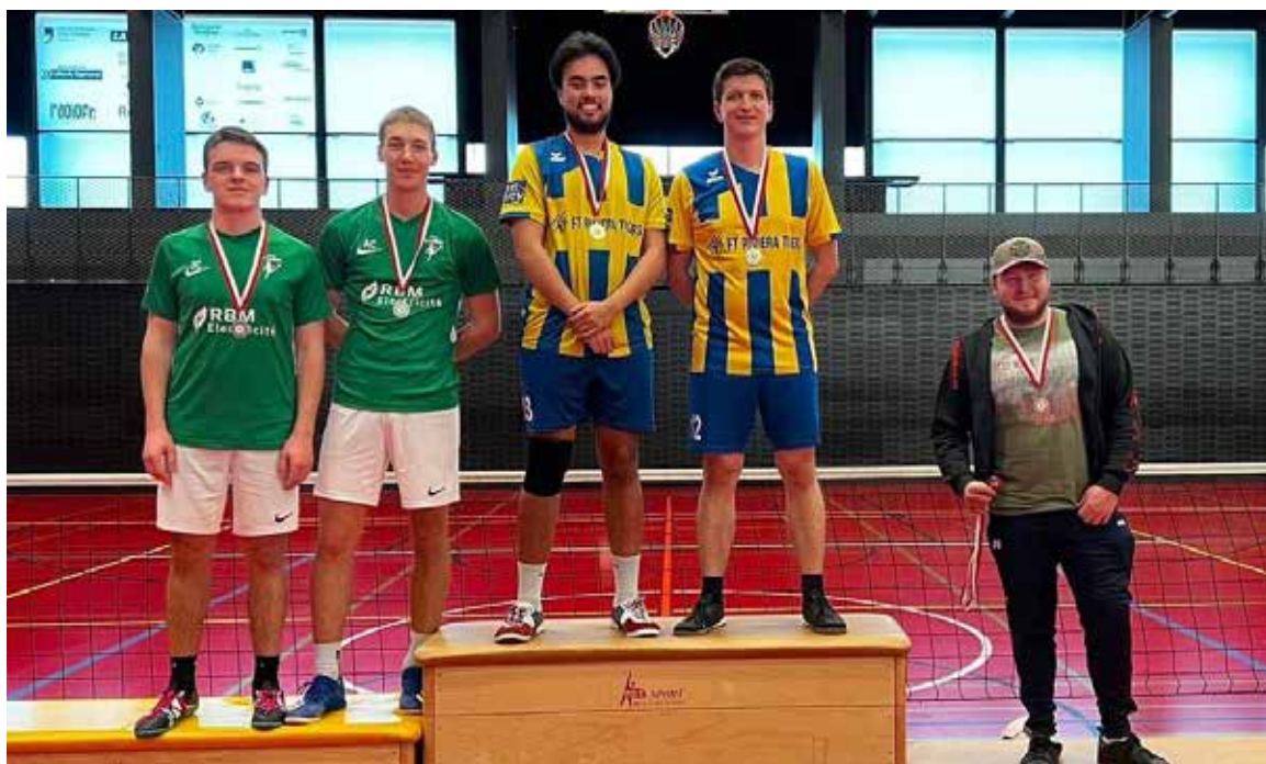
Deuxième place suisse dans la catégorie actifs

Après une première saison annulée par le covid, nous étions impatients d'enfin nous frotter aux autres clubs de suisse lors du championnat qui débutait au mois d'octobre 2021. Nos deux équipes masculines ont pu montrer leurs capacités en 3 e ligue pendant que notre équipe féminine jouait dans son propre groupe. Le plus important cette saison était de prendre de l'expérience et de découvrir les matchs en compétition face à des adversaires qui ont pour la plupart déjà quelques années de futnet dans les jambes. Les résultats ont été plutôt positifs pour nos trois équipes qui ont montré de belles choses tout au long de la saison.