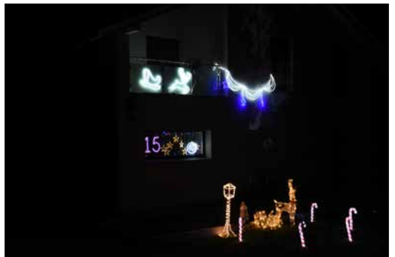
Famille Tercier-Meireles Rte de Perrey 14 / 15 décembre