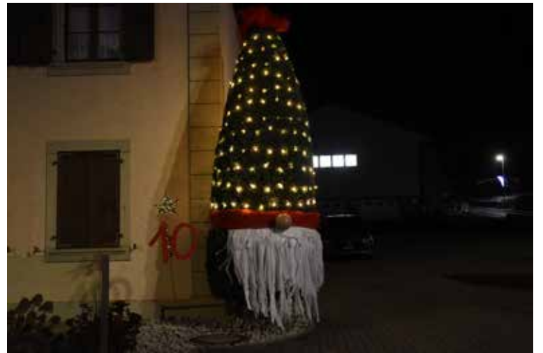
La famille du Sinet Au Gottau 15 / 10 décembre