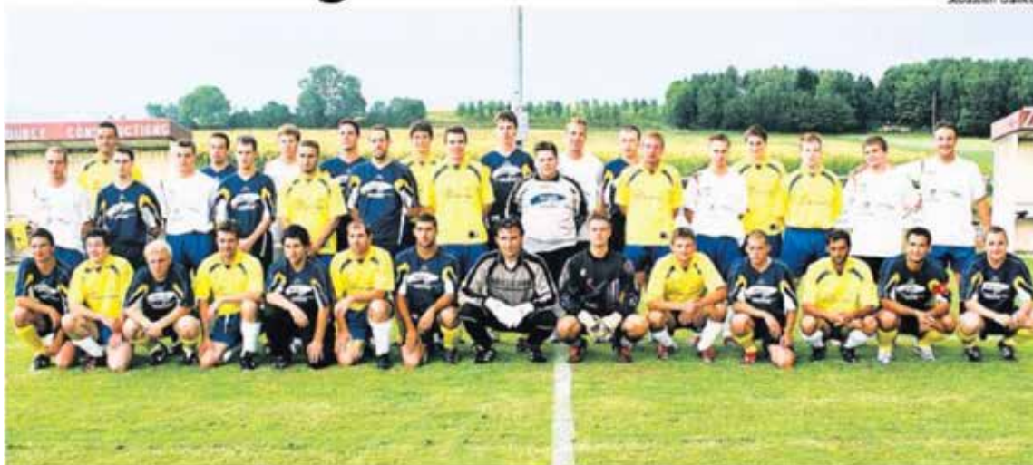
Tous les acteurs de ce derby entre St-Aubin/Vallon I1b et St-Aubin/Vallon I1a posent avant le début du match.