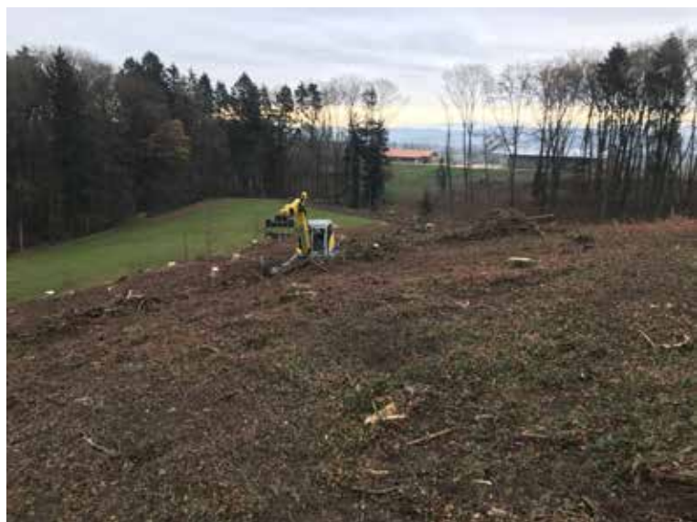
Nettoisement de la surface à planter

privés (décisions), forestier (martelage et conseils), entreprise (organisation du projet et réalisation des travaux), le canton et la Confédération (octroi de subventions pour la plantation de chênes). Tous les acteurs ont un intérêt commun à trouver une solution équilibrée pour garantir la pérennité de cette forêt. Depuis 2021, la Confédération et le canton peuvent subventionner les plantations de chênes dans les limites des contingents à disposition pour les privés. Cette subvention va permettre de lancer et créer un projet de plantation de chênes sur plusieurs propriétés privées pour une surface totale de 1,29 ha.