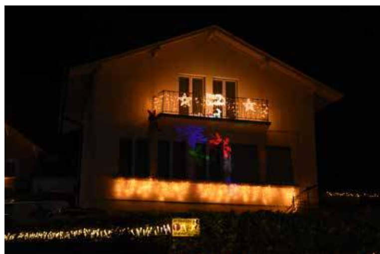
Laura Martinucci / Rte de la Côte-aux-Moines 4 (Les Friques) / 21 décembre