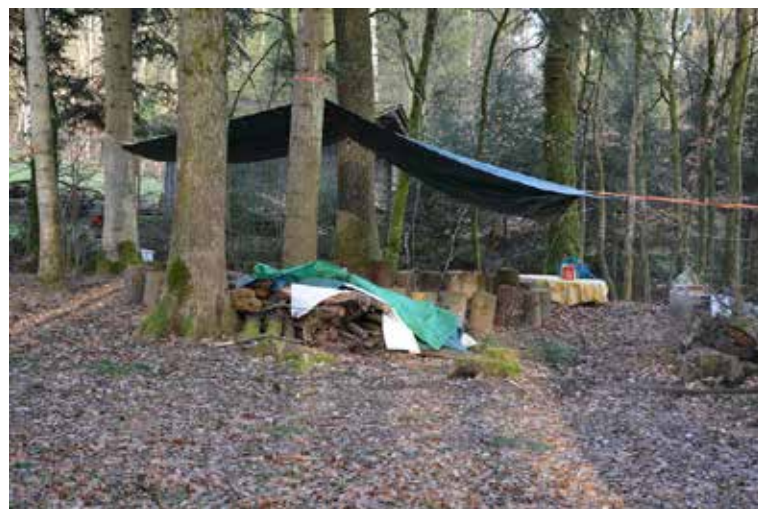
Le campement au cœur de la forêt

lume le feu qui lui permettra de préparer le thé chaud qu'elle servira aux enfants pour la récréation.