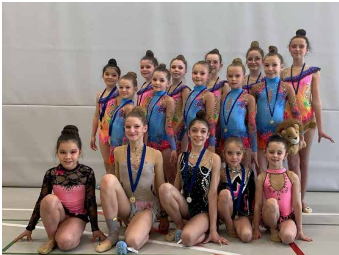
Les gymnastes de la GR lors de la compétition de l'Open Broyard à Moudon