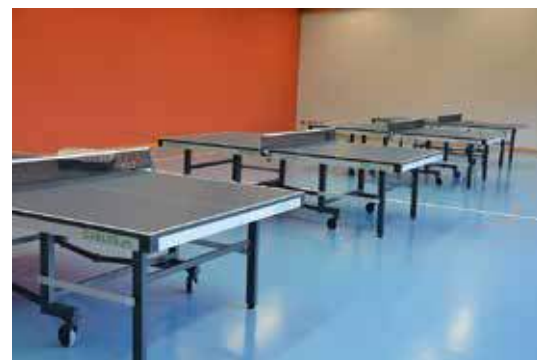
Les nouvelles tables

Pour le CTT, Elise Dessibourg avec la collaboration de Fabrice Collaud