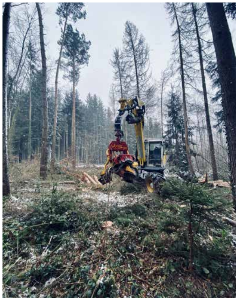
Coupe de conversion : Photos du chantier : Débardage au porteur