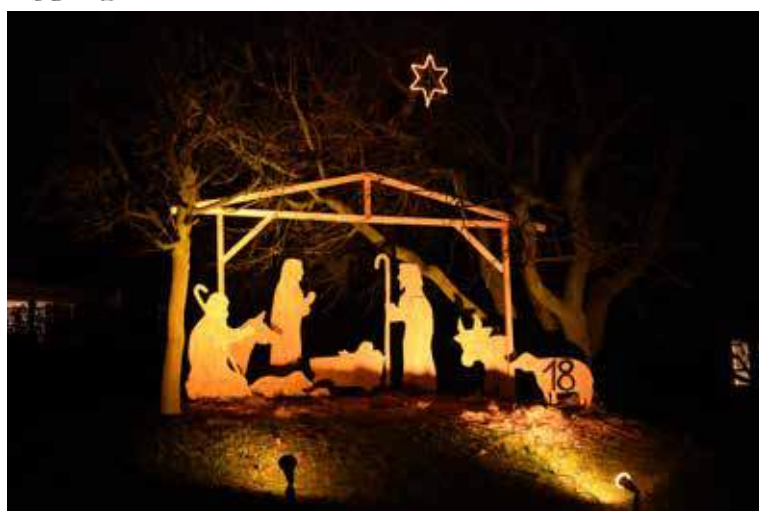
Habitants de l'Impasse / Impasse des Cerisiers / 18 décembre