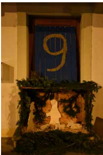
Acer Jardin et StefaCo / Rte de la Croix 48 / 9 décembre