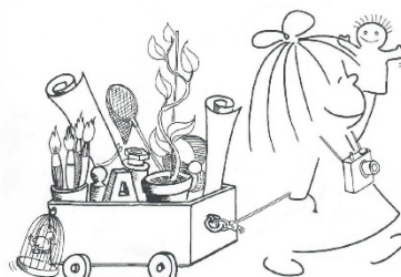
Dessin de Francesco Tonucci Utilisation autorisée

Pour le développement de la communication, du langage et des apprentissages :