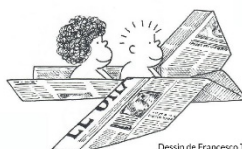
Dessin de Francesco Tonucci Utilisation autorisée

La communication, l'imitation, la manipulation, l'activité physique, la créativité, les émotions et les comportements sociaux ne s'apprennent pas sur les écrans !